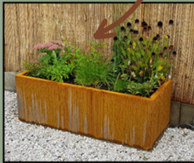
2.Colour after a few weeks