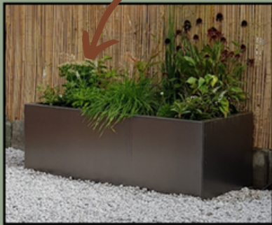
1.Colour at delivery